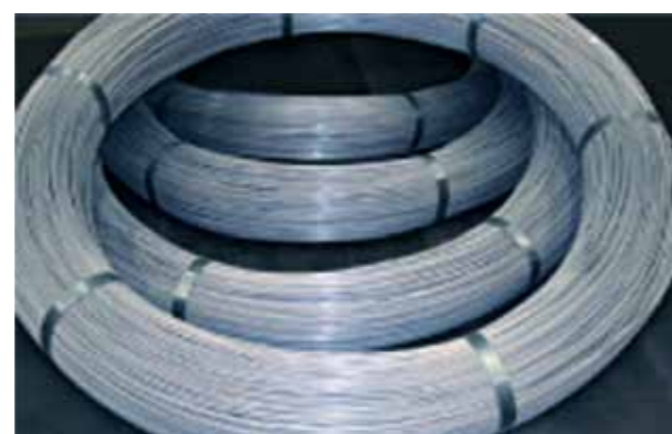
Rouleaux de fils pour béton précontraint