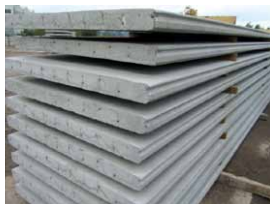
Panneaux en béton précontraint