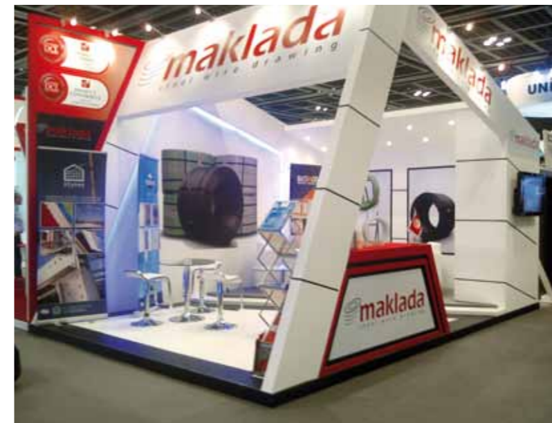
Big Five – Dubai 2012