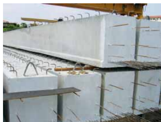
Poutres en béton précontraint