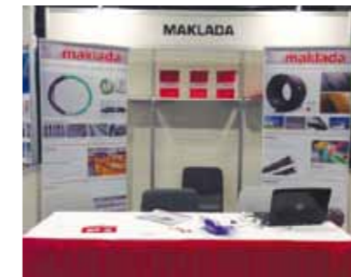
World of concrete - Las Vegas 2014