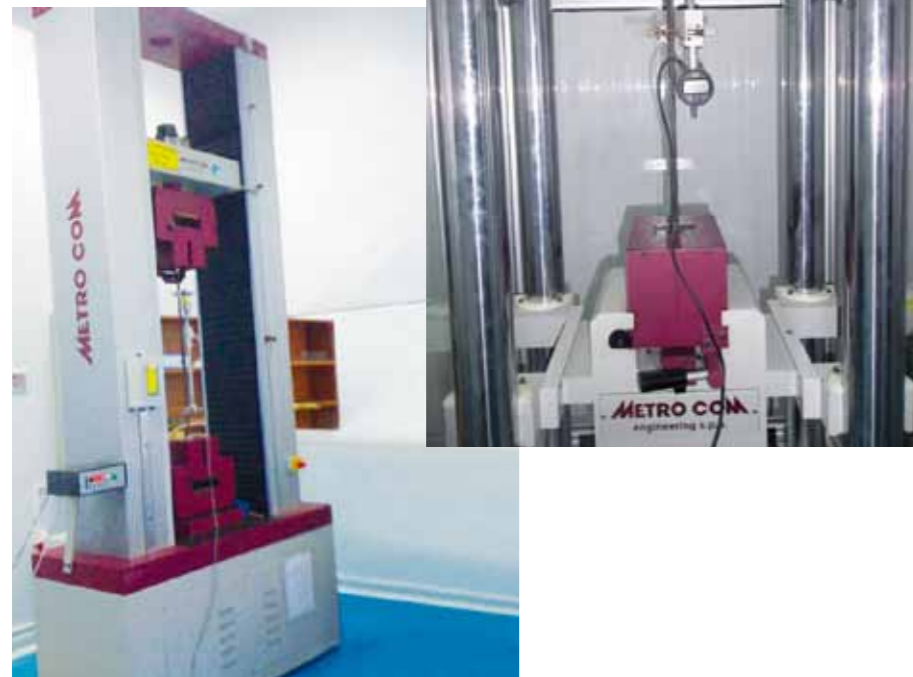
Equipements de contrôle

Les caractéristiques des fils sont contrôlées durant toutes les étapes de fabrication suivant un plan de contrôle détaillé: nettoyage, tréfilage et stabilisation.