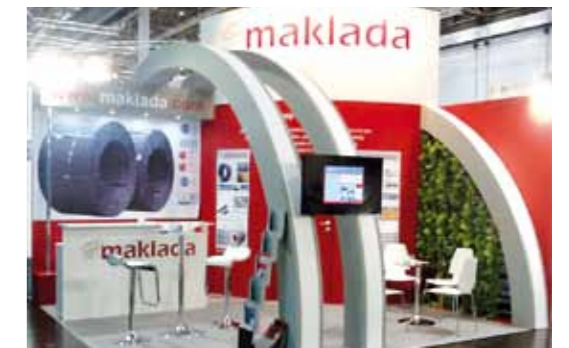
Wire- Dusseldorf 2014