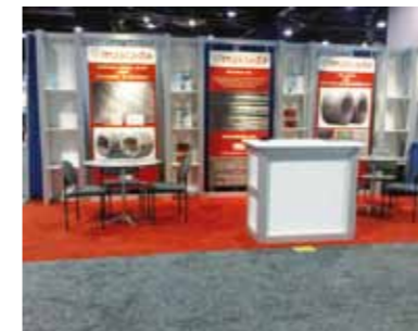
Interwire- Atlanta 2013