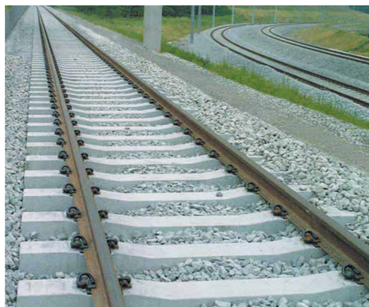
Traverses pour chemins de fer