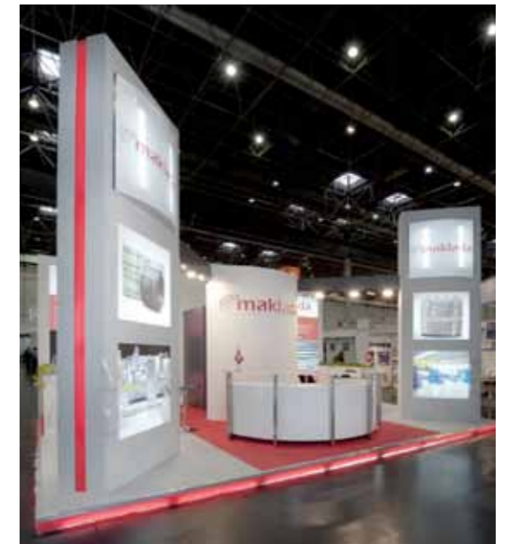
Batimat - Casablanca 2012