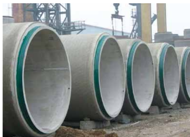
Tuyaux haute pression